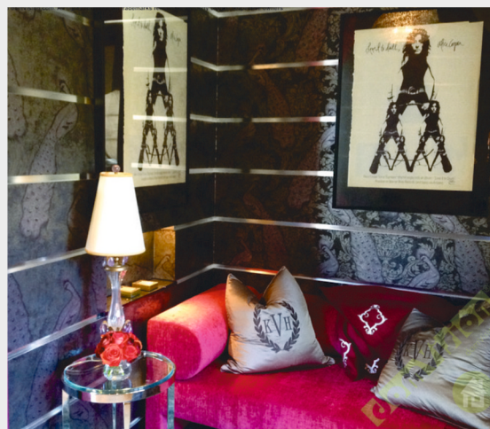
Дом Рока (Лос-Анджелес, США)

Посмотрите, какие Умные дома уже сделаны на iRidium!